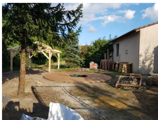
Sites de l'étang du Groc et du verger partagé, projets lauréats du budget participatif charentais – Photos de gauche : avant travaux – Photos de droite : pendant travaux – L'inauguration des deux projets lauréats aura lieu le 15 octobre 2021.