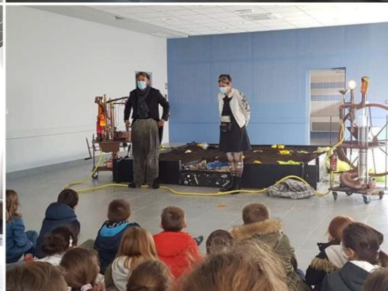
Spectacle « Histoires de fouilles » de David Wahl – Cie INCIPIT, représentation du 30 mars 2021 devant les élèves de l'école de Torsac